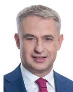
Krzysztof Gawkowski, Wicepremiera, Ministra Cyfryzacji