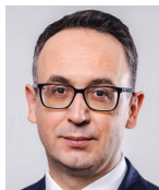
Dariusz Klimczak, Ministra Infrastruktury