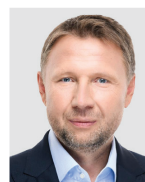
Marcina Kierwińskiego, Ministra Spraw Wewnętrznych i Administracji