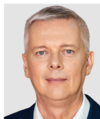
Tomasz Siemiona, Ministra - Członka Rady Ministrów, Koordynatora Służb Specjalnych