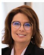
Małgorzata Kidawy-Błońskiej, Marszałek Senatu