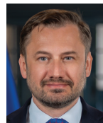
Aleksandra Miszałskiego, Prezydenta Krakowa